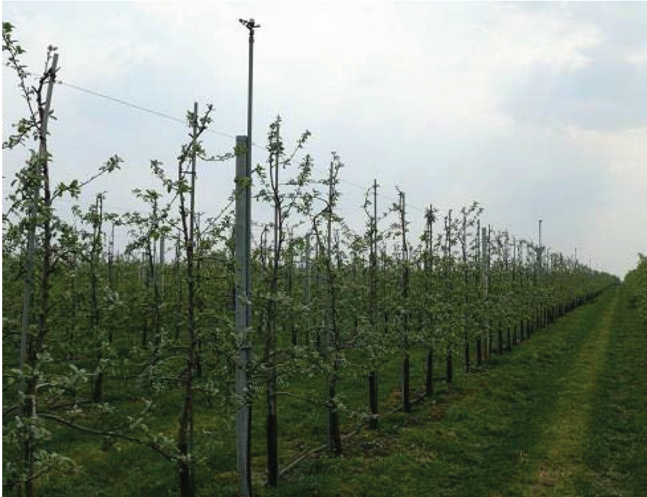
Fotografia 1. Sad śliwowy

uzupełniającą okresowe braki i nierównomierność opadów, stanowiący czynnik intensyfikujący i stabilizujący plonowanie (Żarski i in. 2006). Drzewa szczepione były na podkładce siewki Węgierki Wangenheima. Między rzędami drzew utrzymywano murawę, a w rzędach drzew ugór herbicydowy. Ilość drzew na hektar była zróżnicowana i wahała się od 1137szt ·ha -1 (odmiana Jojo) do 1532 szt ·ha -1 drzew odmiany Hanita. Częstotliwość i wielkość dawki nawodnieniowej ustalano przy pomocy tensometru, gdy potencjał wodny gleby obniżał się poniżej – 0,01 MPa. Tensjometry umieszczono w rzędzie drzew na głębokości 20-25cm. Do nawadniania użyto mikrozaszczazy typu „Head” o 2X20 (40 0 ) o rozstawie co 3m i w rzędach 4m. W artykule przedstawiono tylko wpływ czynnika nawodnieniowego na plon śliw. Zastosowano nawożenie mineralne przed założeniem sadu w ilości: wapnowanie 3,5 t/ha (CaCO 3 ) i obornik 25t/ha oraz bieżące nawożenie mineralne czystego składnika w kg/ha: 18 g/m 2 pod drzewko N, Mg O 10 g/m 2 .