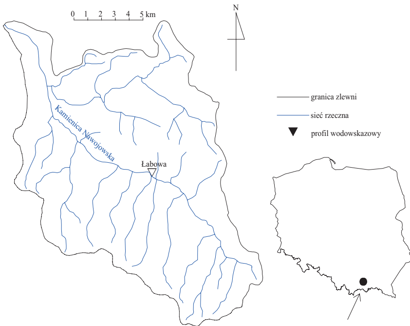
Rysunek 1. Lokalizacja i sieć rzeczna Kamienicy Nawojowskiej do przekroju Łabowa

górskich: Krzyżówki i Roztoki. Ze względu na przebieg ciek wzdłuż drogi krajowej, łączącej Nowy Sącz z Krynica, Kamienica została poddana częściowo regulacji. Natomiast w swoim górnym biegu rzeka zachowała naturalny charakter (Strutyński 2015). Podstawowe charakterystyki fizjograficzne zlewni zamkniętej profilem wodowskazowym Łabowa to: powierzchnia A : 66,1 km 2 ; długość ciek L : 13,4 km; średni spadek zlewni \Psi : 0,061 (Stachy 1986; Dynowska i Maciejewski 1991).