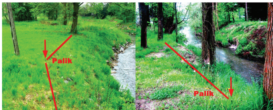
Figure 1. The course of the shore line in cross-section.