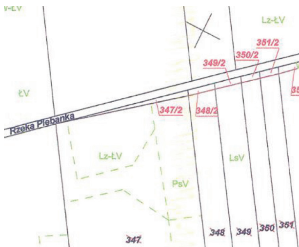
Figure 4. Fragment of a map with the draft delimitation stream Bulówka.