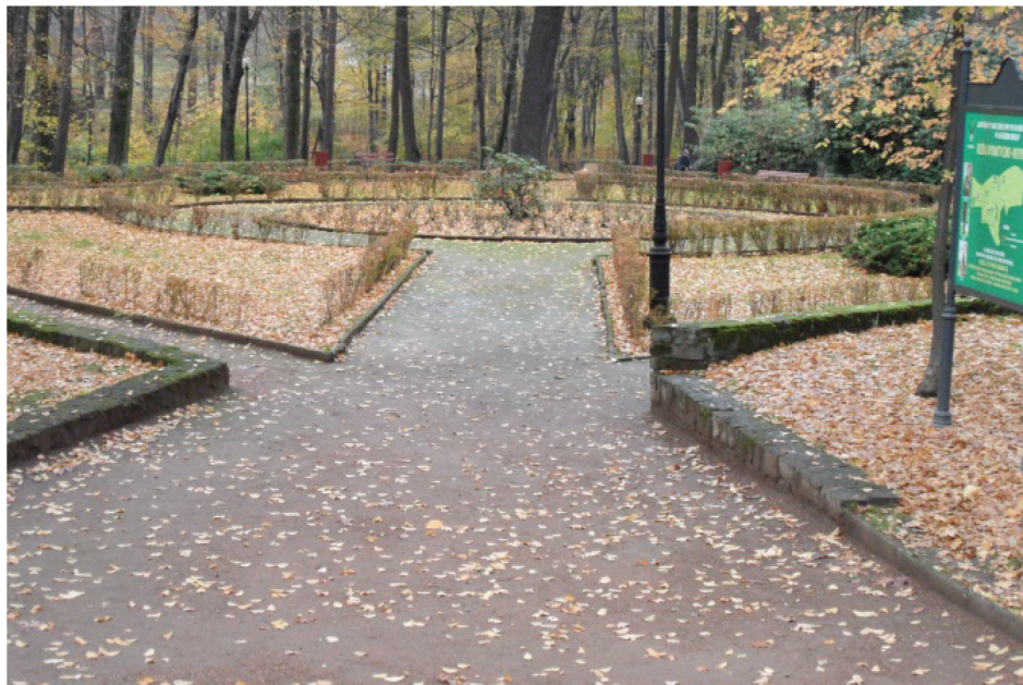
Fotografia 1. Park Zdrojowy im. dr M. Witzaka (1861 r.) z dobrze zorganizowanymi ścieżkami spacerowymi (fot. autorki, listopad 2012)

riałach uzyskanych w gminie, wywiadach środowiskowych oraz informacjach zawartych w wykazanym piśmiennictwie. Zgromadzone informacje potwierdzone zostały dokumentacją fotograficzną.