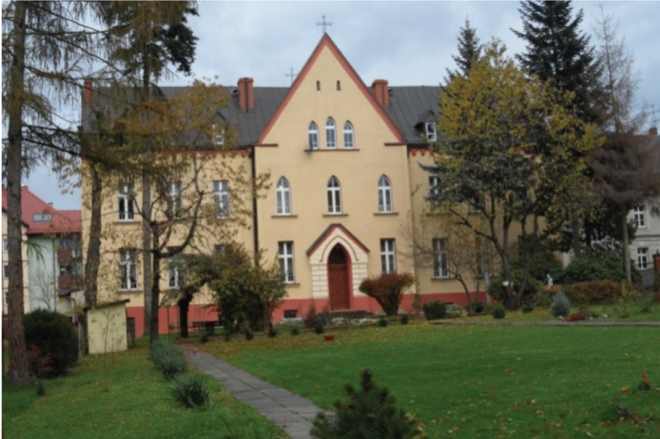
Fotografia 9. Dawny i obecny zespół klasztorny sióstr Boromeuszek z 1891 r. (fot. autorki, listopad 2012 r.)