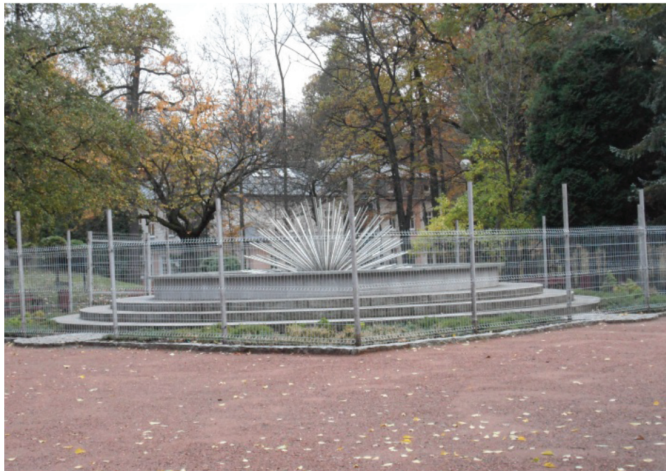
Fotografia 12. Fontanna nieopodal byłego Domu Zdrojowego (fot. autorki, listopad 2012)

te elementy stanowić mogą wzór dla niektórych funkcjonujących uzdrowisk, jak należy aranżować tego typu przestrzenie, bacząc przede wszystkim na topografię terenu.