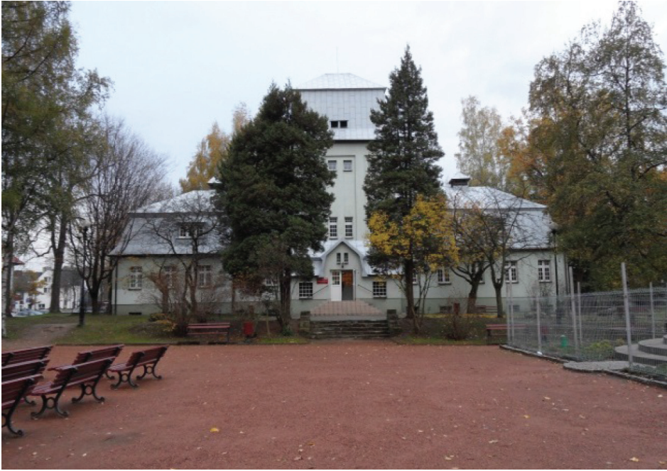
Fotografia 6. Łazienki II (1912 r.) usytuowane naprzeciw Domu Zdrojowego – obecnie Miejski Ośrodek Kultury, Galeria Historii Miasta