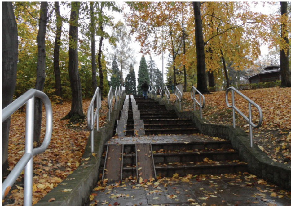
Fotografia 11. Park Zdrojowy, schody terenowe dostosowane dla osób niepełnosprawnych i matek z małymi dziećmi (fot. autorki, listopad 2012) Photo 11. The Spa Park, terrain stairs adapted for the disabled and mothers with small children (photo by authoress, November 2012)

sanatoriami „Mieszko”, „Dąbrówka” (dawna „Betania”), pawilonem nr 3 (dawne sanatorium Spółki Brackiej), willą „Opolanka”, zespołem klasztornym i kościołem pw. Najświętszego Serca Pana Jezusa (dawny Zakład Marii) i „Domem Aniołów Stróżów”, został wpisany do rejestru zabytków klasy „A”.