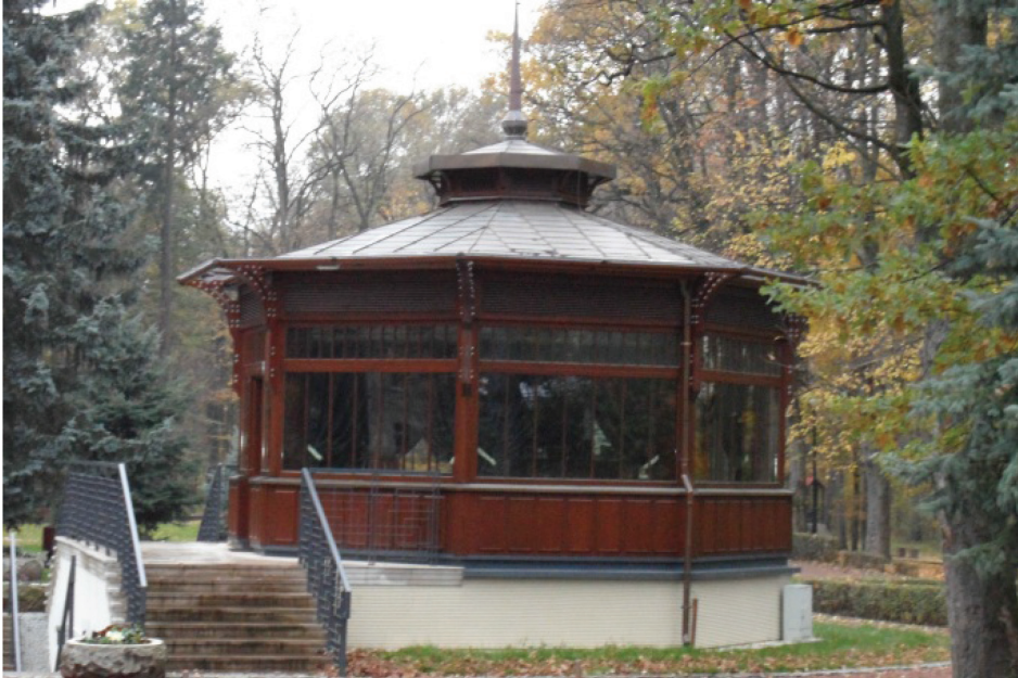
Fotografia 4. Pijalnia wód z 1861 r. w Parku Zdrojowym Photo 4. The Water Drinking House in the Spa Park from 1861

zusa (3 ćw. XIX w.); budynek byłego Szpitala Kolejowego (1909); pijalnia wód (1861); muszla koncertowa (1862); budynek Betania III – obecnie hotel i restauracja „Dąbrówka”.