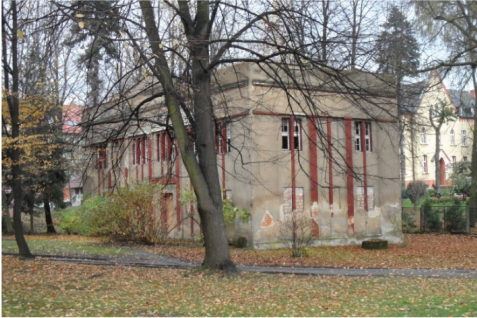
Fotografia 8. Łazienki III (1920 r.) – obecnie budynek w ruinie (listopad 2012 r.)