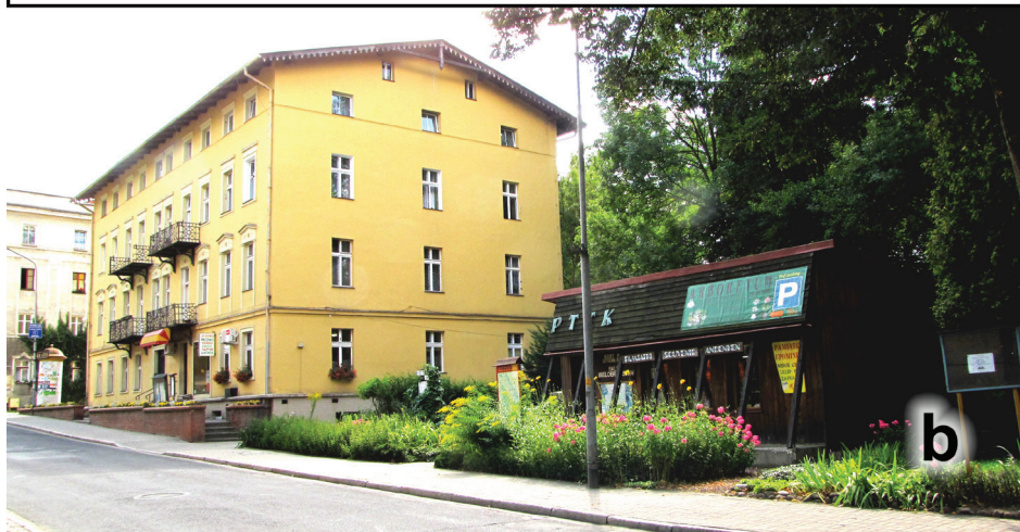
Gastronomia – a; handel – b; gastronomy – a; trade – b