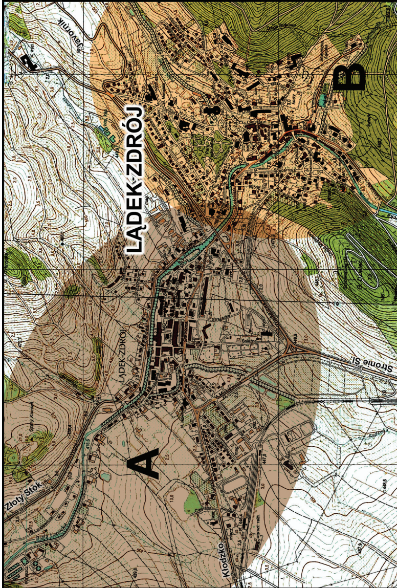
A – część miejska; B – część uzdrowiskowa A – city part; B – health resort part