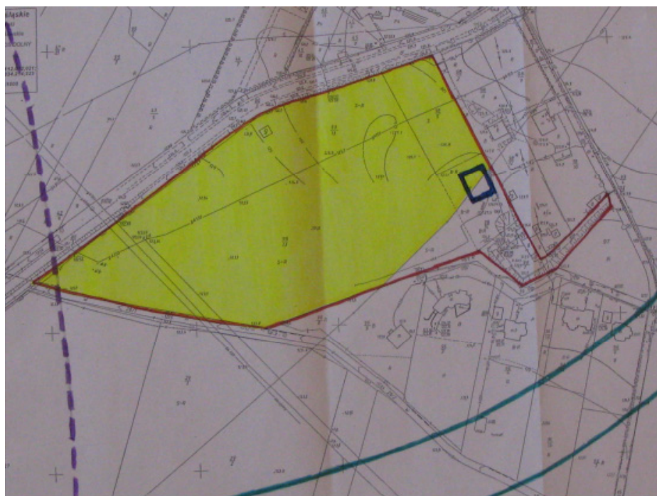
Rysunek 2. Usytuowanie wywłaszczanej części gospodarstwa sadowniczego. Pole żółte obszar objęty decyzją wywłaszczeniową. Linie: czerwona – ogrodzenie nieruchomości, fioletowa przerywana – strefa budowanej autostrady, zielona – granice nie zrealizowanej, projektowanej w MPZP drogi publicznej, ciemnoniebieska - zarys budynku chłodni owoców

Oprócz wymienionych obiektów gospodarstwo wyposażono w szereg urządzeń i instalacji, w tym: 2 nawadniające i 1 awaryjny zbiornik wodny, 4 studnie głębinowe, system odprowadzania wód po myciu chłodni, pompy, maszt reklamowy, konstrukcje sadownicze, elementy małej architektury.