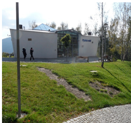
Fotografia 8. Budynek pijalni wód leczniczych oddany do użytku w czerwcu 2012 roku (fot. autorki, październik 2012)

Photo 7. Fountain in close vicinity to the curative water well-room (photo by authoress, October 2012)