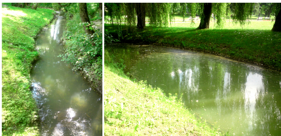
Fot. 1. Rzeka Bochońniczanka przed stawem w Parku Zdrojowym w Nałęczowie w lipcu 2012 r.

uporządkowana gospodarka ściekowa w wiejskich jednostkach osadniczych (głównie w Cynkowie) oraz nieumiejętne stosowanie nawozów mineralnych i organicznych. Na skutek dopływu zanieczyszczeń ze zlewni jakość wody w rzece Bochońniczance ulega stopniowemu pogorszeniu. Konsekwencją tego jest również zmiana warunków ekologicznych w stawie w Parku Zdrojowym w Nałęczowie. Na podstawie obserwacji wykonanych w 2012 roku można stwierdzić, że staw jest zbiornikiem silnie zeutrofizowanym (fot. 1). W okresie wegetacyjnym w stawie stwierdzono m.in. silne zakwity glonów, małą przejrzystość wody, nieprzyjemny zapach, czy deficyty tlenowe, które powodowały masowe śnięcie ryb.