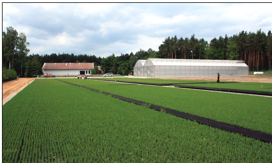
Fotografia 1. Otwarte pole produkcyjne i namioty foliowe w szkółce kontenerowej Bielawy

o pojemności 120 cm 3 , a dla brzozy i lipy 24 pojemniki o pojemności 250 cm 3 każdy. Przez ok. 1 miesiąc kontenery znajdowały się w namiocie foliowym, który zapewnia optymalne warunki mikroklimatyczne do rozwoju siewek. W celu maksymalizacji wykorzystania linii produkcyjnej, sadzonki po miesiącu intensywnego wzrostu przeniesiono na zewnętrzne pole zraszania, gdzie pozostały do końca cyklu produkcyjnego (fot. 1).