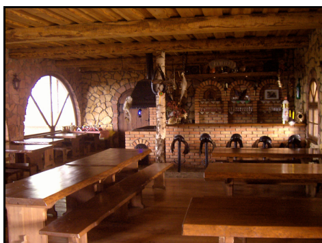
Rysunek 15. Jadalnia połączona z ujeżdżalnią Figure 15. Dining room combined with the riding school

ciami stajennymi oraz teorią jazdy wynosi średnio 700 zł. Gospodarze wprowadzają w tym względzie różne systemy ulg, w zależności od liczby gości, ich wieku i czasu pobytu.