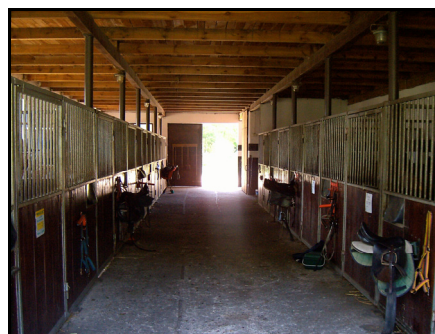
Rysunek 6. Stajnia dla koni Figure 6. Stable for horses