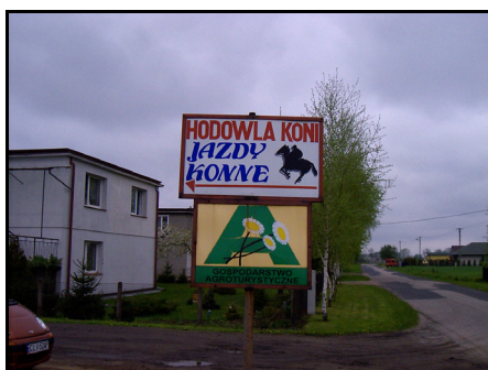
Rysunek 17. Reklama przy drodze Figure 17. Advertising on the road

Pozytywną rzeczą, którą ujawniły badania jest to, że 23,8% gospodarzy planuje nowe działania inwestycyjne, by podnieść standard usługi. Jeden z właścicieli pragnie wzbogacić swój produkt poprzez wybudowanie hali sportowej. Dwóm innym przyświeca cel postawienia hali do zawodów jeździeckich oraz krytej ujeżdżalni. Byli też tacy, którzy deklarowali zakup koni do przewozu bryczką i kuców dla dzieci.