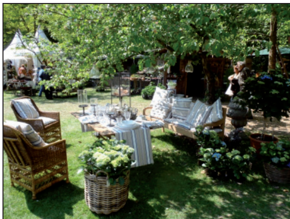
Fotografia 1. Przykład aranżacji wnętrza ogrodowego o charakterze rekreacyjnym. Wystawa Blumen & Ambiente, Gut Wienhausen (Autor: A. Jaszczak)