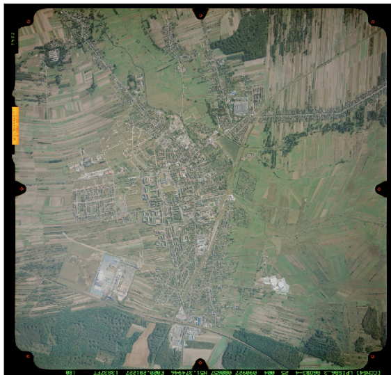
Rysunek 1. Lewe zdjęcie stereogramu Figure 1. Left stereogram photo