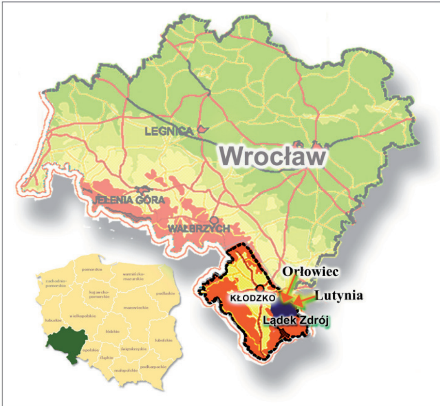
Rysunek 1. Terytorium badań Figure 1. Territory of study

Terenem prowadzonych obserwacji są dwie, dziś niewielkie (ok. 60–80 stałych mieszkańców) wsie: Orłowiec i Lutynia zlokalizowane w gminie Łądek Zdrój, powiat Kłodzko, województwo dolnośląskie - rys. 1.