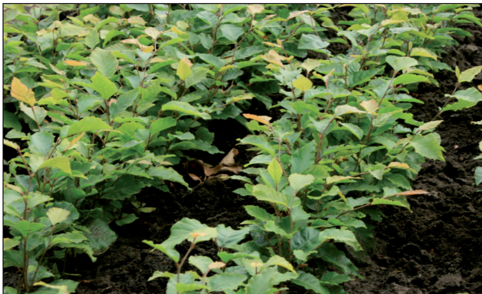
Fotografia 1. Nieściółkowane sadzonki buka w okresie jesieni Photo 1. Non-mulched seedlings of European beech in autumn