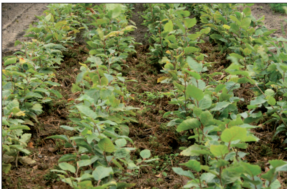
Fotografia 2. Sadzonki buka w okresie jesieni po przeprowadzeniu zabiegu ściółkowania Photo 2. Seedlings of European beech in autumn after the measure of mulching