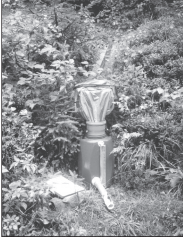
Fotografia 1. Naczynie pomiarowe Foto 1. Measuring utensil

z powierzchni badanego odcinka i tej wody, która ewentualnie wypływała z przeciętego skarpy stoku. U wylotu każdego wodospustu pomiarowego umieszczano wyskalowane naczynie (fot. 1), za pomocą którego mierzono ilość spływającej z odcinka wody.