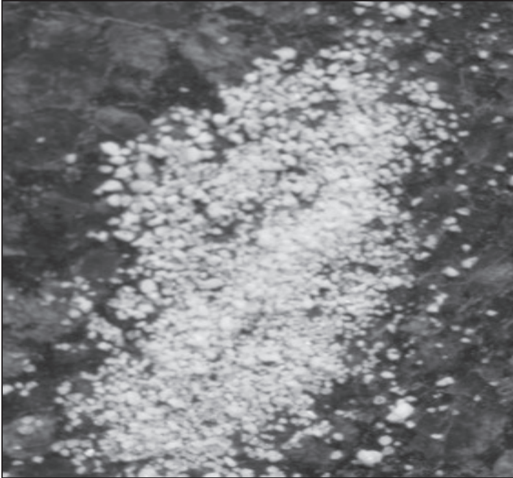
Rysunek 1. Granulat AgroHydroGel służący do mieszania z podłożem (fot. własna) Figure 1. Granulate AgroHydroGel used to mixing with substratum (fot. priv.)

Celem badań niniejszego opracowania było przedstawienie wpływu AgroHydroGelu na wysokość i jakość plonu pieczarek uprawianych w warunkach sterowanego mikroklimatu.