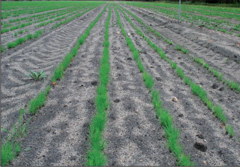
Fotografia 1. Sadzonki sosny latem 2009 r. – stanowisko bez nawożenia organicznego i ściółkowania (MC) Photo 1. Scots pine in summer 2009 – stand without organic fertilization and mulching (MC)