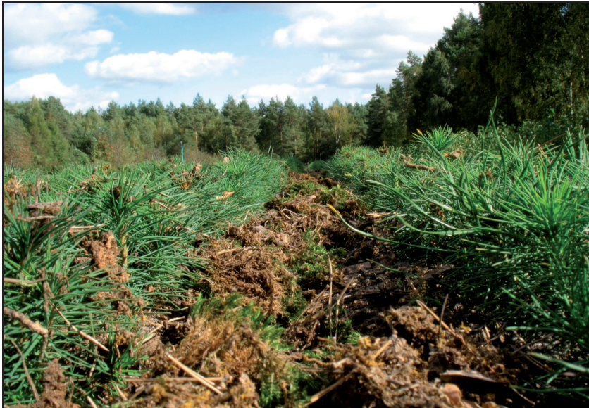
Fotografia 2. Stanowisko ściółkowane (SM) we wrześniu 2009 r. Photo 2. Stand mulched (SM) in September 2009