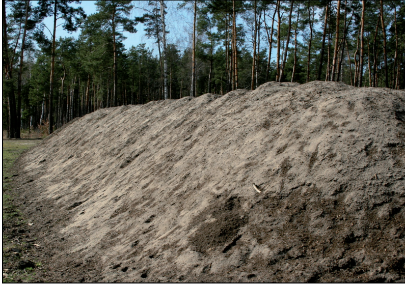
Fotografia 1. Składowany na pryzmie kompost użyty w doświadczeniu Photo 1. Compost pile with compost applied in the experiment