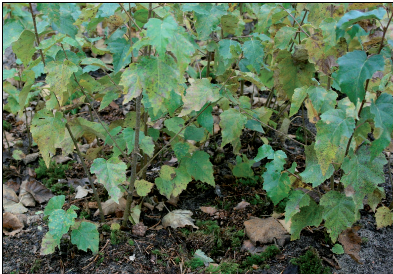
Fot. 2. Stanowisko brzozy ściółkowane i nawożone kompostem z ektopróchnicy (SK) jesienią 2009 r.