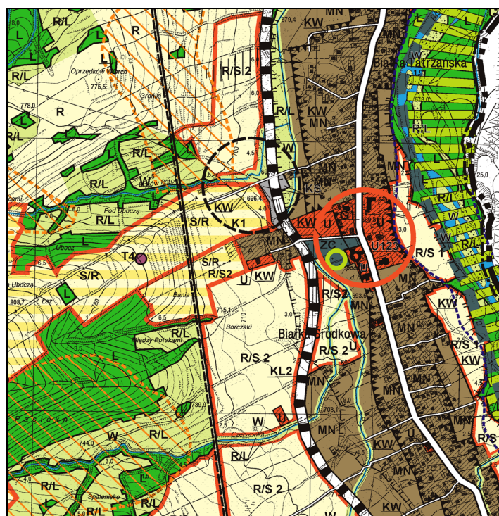
Rysunek 3. Zmiana studium uwarunkowań i kierunków zagospodarowania przestrzennego gminy Bukowina Tatrzańska dla obszaru wsi Białka Tatrzańska (2006) – fragment

Do tej pory miejscowość postrzegana była, jako wieś o funkcji turystyczno-rolniczej. Na rys. 3. zamieszczono analizowany fragment miejscowości.