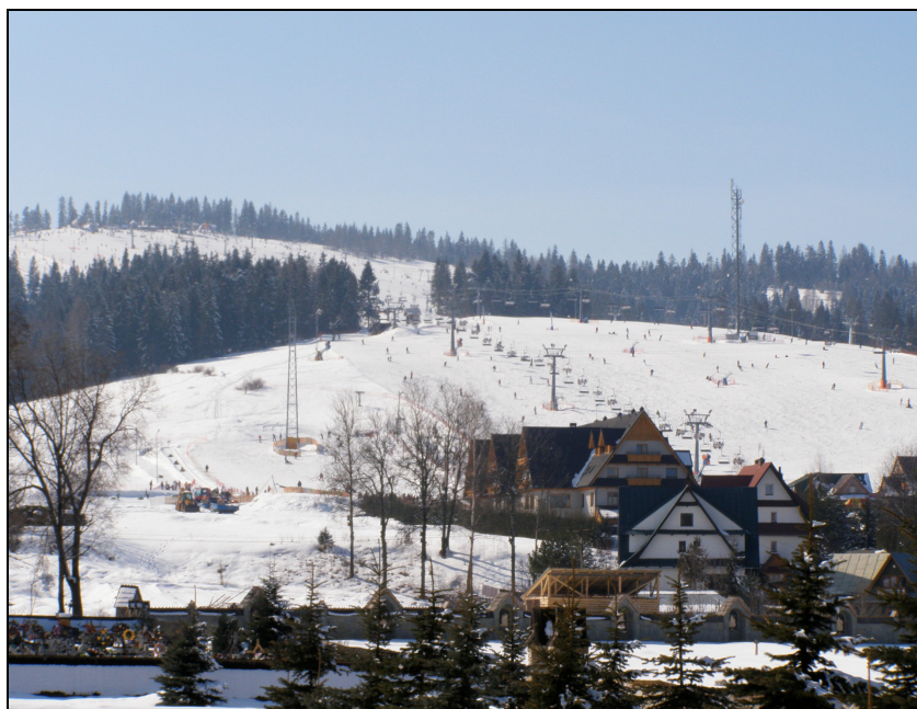
Fotografia 1. Białka Tatrzańska. Panorama z wieży Kościoła Św. Szymona i Judy.

Powyższy fragment ryciny Zmiany Studium... (rys. 3), przedstawia obszary zainwestowane i przeznaczone do zainwestowania, wśród których znalazły się m.in.: tereny zabudowy mieszkaniowej oznaczone symbolem M, tereny zabudowy usługowej (symbol U), tereny rekreacyjno – rolnicze przeznaczone dla koncentracji infrastruktury sportowo-rekreacyjnej (symbol S/R). W analizowanym fragmencie Studium... wskazano także obszary naturalne o potencjalnej możliwości zainwestowania, wśród których znalazły się tereny zabudowy rolniczej oraz tereny rolniczo – rekreacyjne (o potencjalnej możliwości lokalizacji infrastruktury sportowo – rekreacyjnej) symbol R/S oraz obszary naturalne wyłączone z zabudowy, w tym: tereny rolnicze (symbol R), tereny lasów (symbol L) i tereny cieków wodnych (symbol W).