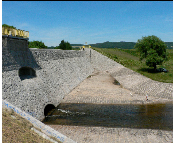
Fotografia 1. Zapora w Sobieszowie od strony wody dolnej, część centralna z okładziną kamienną i niecka wypadowa

Photo 1. Sobieszowice Dam: downstream, with the basin made of concrete with stones