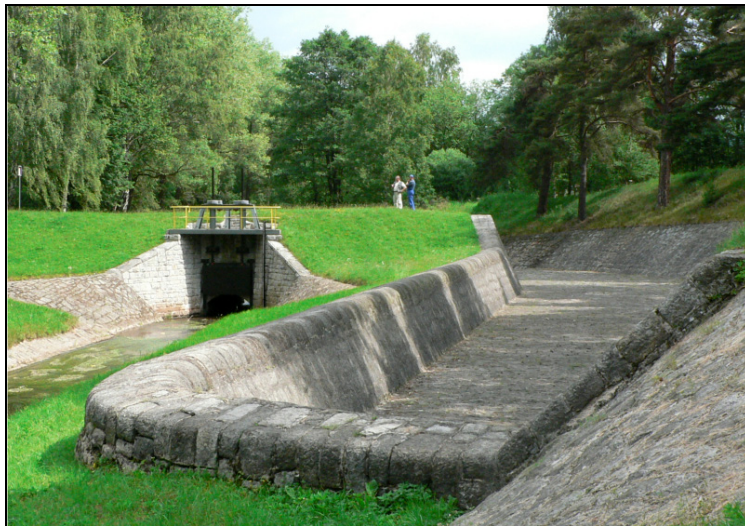
Fotografia 2. Widok zapory Krzeszów od strony wody dolnej; upust denny i przelew boczny

Photo 1. Sobieszowice Dam: downstream, with the basin made of concrete with stones