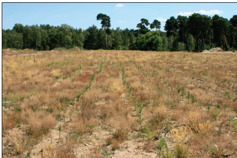
Fotografia 1. Zalesiony teren popoligonowy Bydgoszcz-Jachcice jesienią 2008 r.

cy [Rolbiecki R. in. 2007]. Na każdym poletku (wariancie) wysadzono 500 sadzonek sosny.