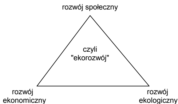
Rysunek 1. Model „ekorozwoju” – ujęcie tradycyjne rozwój społeczno-kulturalny

nego), odnowy (np. środowisk wiejskich), idee wychodzące od inicjatyw lokalnych, „community development”, ekorozwoju itp. Ta ostatnia jest zbliżona lub identyfikowana z „sustainable development” i dlatego m.in. wymaga weryfikacji. Jednym z celów tego studium (referatu, w części II) jest ta właśnie weryfikacja.