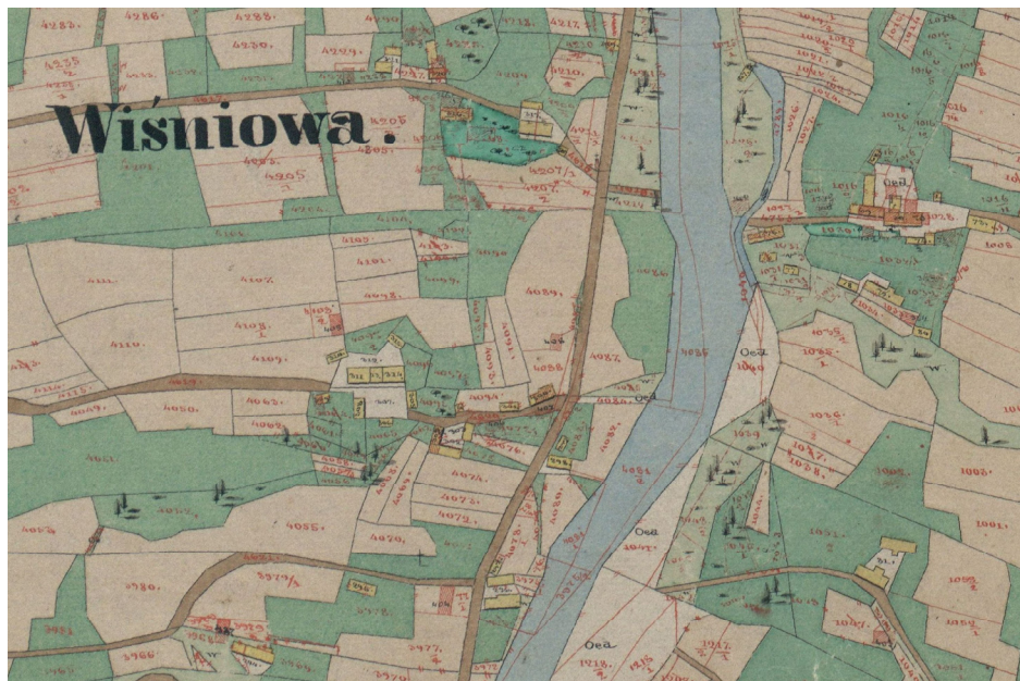
Rysunek 1. Fragment mapy katastralnej wsi Wiśniowa Figure 1. Fragment of cadastral map of Wiśniowa village