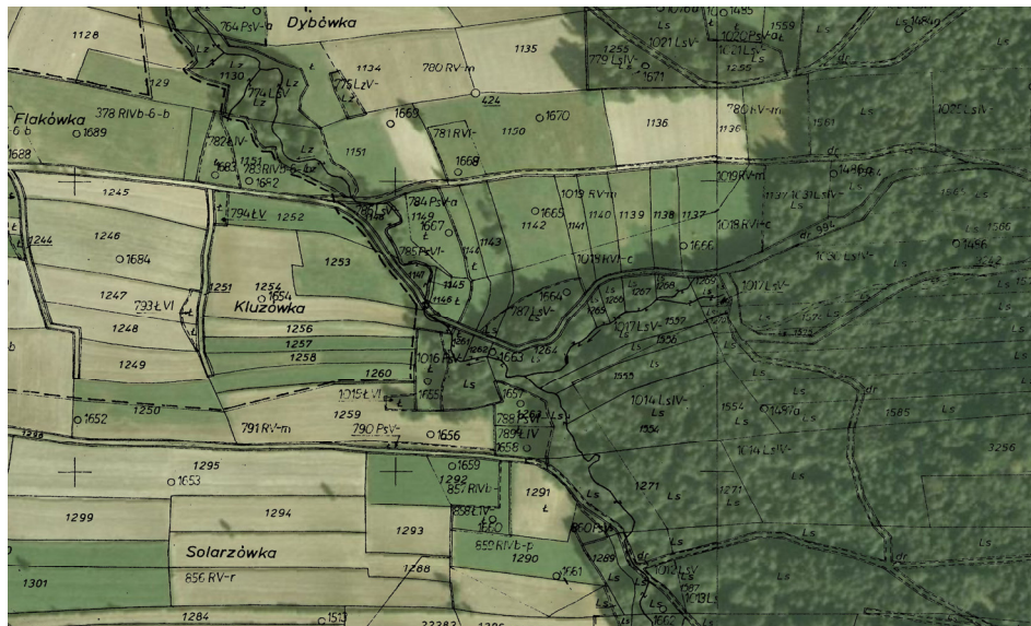
Rysunek 3. Fragment ortofotomapy cyfrowej z nałożonym rastrem mapy ewidencji gruntów i budynków

Opracowanie wielkościowe i przestrzenne kierunków i tendencji zmian w krajobrazach kulturowych stanowi podstawę do przeprowadzenia bardziej szczegółowych analiz, a w konsekwencji do prognozowania kierunków ich kształtowania w przyszłości.