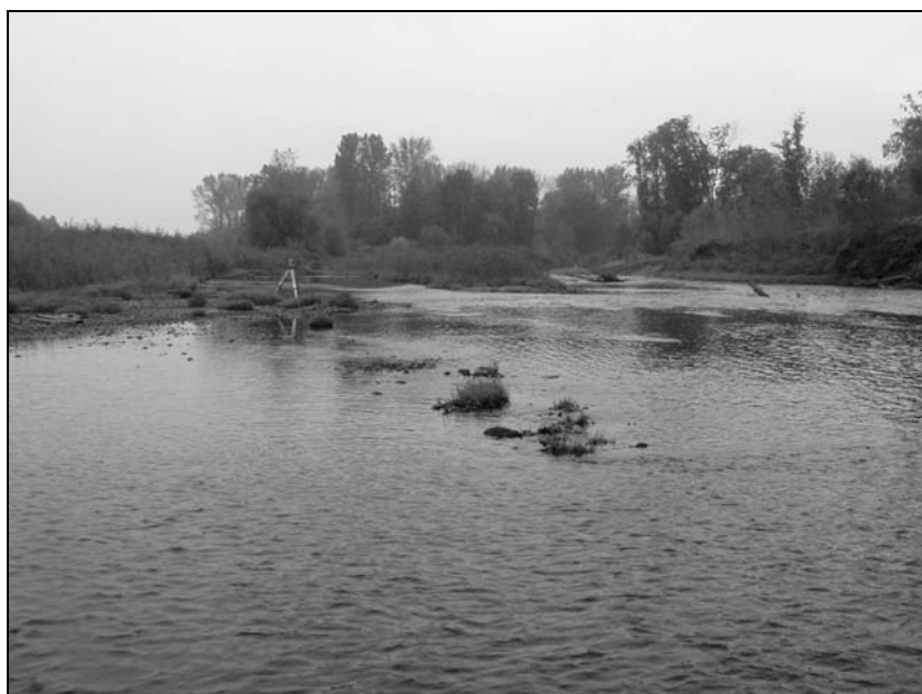
Fotografia 4. Wlot do meandra I, rzeka Odra, km 21,5 Photography 4. Inlet to meander I, Odra river, km 21,5

Odsypiska tworzą się na wszystkich zakolach rzeki, głównie na brzegach wypukłych (fot. 3). Geometria koryta Odry w tym rejonie w ostatnich latach zmienia się bardzo dynamicznie. Szczególnie widoczne jest to na wlocie do meandra I i IV (fot. 4) oraz w ich starych odnogach (fot. 5).