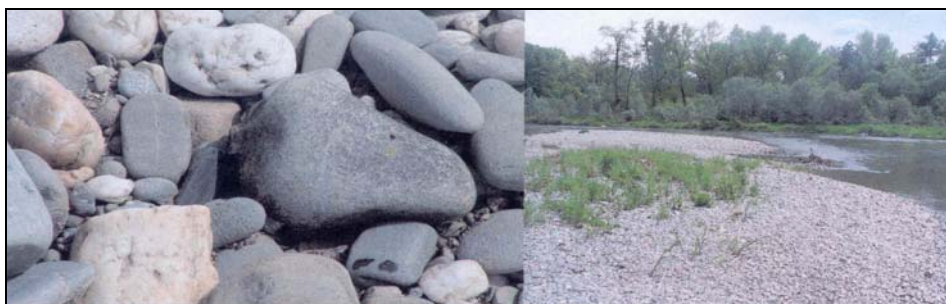
Fotografia 3. Obrukowanie i odsypiska żwirowo-kamieniste, rzeka Odra Photography 3. Pavement and gravel-stony outwashes, Odra river

W celu realizacji planowanych zadań autorzy wykonali wiele pomiarów na Odrze w rejonie meandrującego odcinka. Podczas niskich stanów (przepływy Q rzędu 10–12 m 3 /s) pobrano materiał dennego. Pobierano go z powierzchni dna rzeki za pomocą łopaczki oraz z podłoża (do głębokości 40 cm) metodą zamrażania. Aktualnie dno rzeki na odcinku tuż powyżej pierwszego meandra jest obrukowane. Są to głównie kamienie i żwiry o średnicy dochodzącej do kilku-kilkunastu cm (fot. 3). Pobrano też materiał tworzący odsypiska na brzegach wypukłych. Ich średnica jest zbliżona do materiału tworzącego obrukowanie. Wykonano również sondowanie koryta głównego oraz pomiary prędkości przepływu w wybranych przekrojach młynkiem elektromagnetycznym Flo-Mate 2000. Przeprowadzono także pomiary geometrii koryta rzeki oraz mostów znajdujących się powyżej.