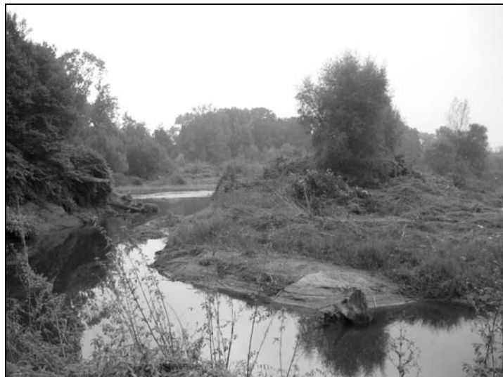
Fotografia 5. Stara odnoga meandra I, rzeka Odra Photography 5. Old branche of meander I, Odra river

Wyspy, odsypiska i gęsta roślinność w korycie Odry mają decydujący wpływ na opory ruchu i to zarówno w strefie niskich i średnich, jak i wysokich stanów.