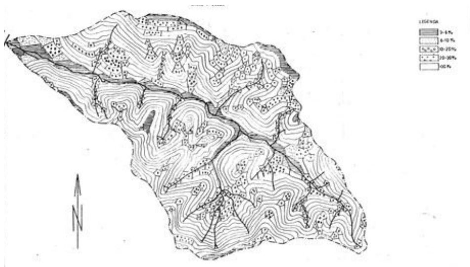
Rysunek 1. Mapa spadków w zlewni potoku Wielka Puszcza

Na terenach leśnych dominującym gatunkiem jest świerk. Utworzone przez ten gatunek drzewostany świerkowe zajmują ponad połowę (50,52%) terenów leśnych zlewni, co nie jest zbyt korzystne, gdyż świerczyny często zajmują siedliska przydatne dla lasów mieszanych bukowo – jodłowych o większych walorach przyrodniczych i użytkowych. Bory świerkowe w omawianej zlewni znajdują się na różnych wysokościach i spadkach stoków. Pod względem hydrologicznym są też mniej odpowiednie, gdyż mniej retencjonują wód opadowych niż lasy bukowo-jodłowe o ściółce liściastej będące pozostałością pierwotnej puszczy karpackiej. Według badań Lipskiego [1996] procentowy udział buka w istniejącym zalesieniu wynosi 14,49%, jodły 9,49%, modrzewia 4,69%, a pozostałych drzew, a głównie jawora i brzozy 2,46% istniejącej powierzchni leśnej. Zabudowę biologiczną brzegów potoku tworzą rosnące szpalerowo wierzby (pas korytowy) oraz olsza szara (pas przykorytowy), a miejscami także jesion i wymienione powyżej drzewa leśne.