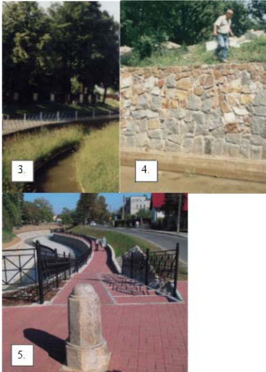
Rysunek 3. Widok sekcji I po przebudowie Figure 3. View of Segment I after rebuilding Rysunek 4. Mur betonowy z okładziną kamienną. Figure 4. Concrete wall with brick facing Rysunek 5. Sekcja IV Figure 5. Segment IV after rebuilding